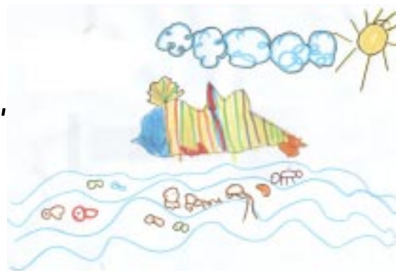
Júlia Comellas (P4 B)

El dofí, alegre i content, travessa l'oceà ràpid com el vent.