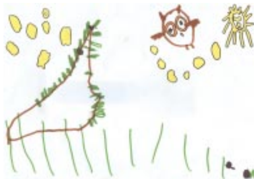
Irina Fontarnau (P3 B)