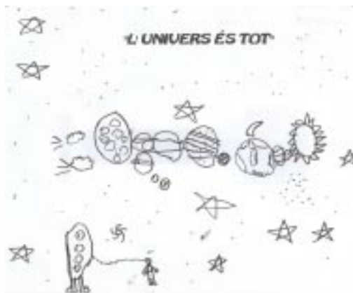
Ivet Lledó (P5 A)