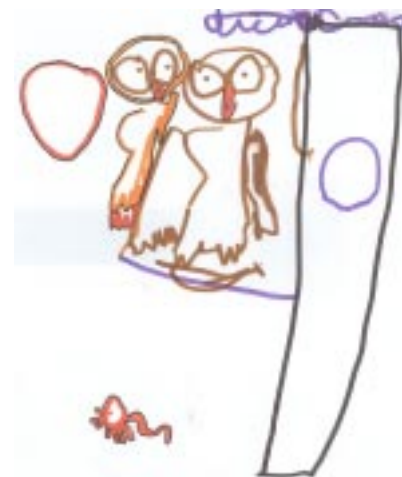
Camila Machado (P3 A)