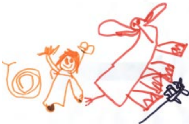
Alba Picó (P3 B)